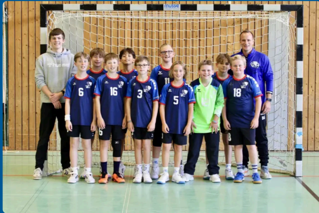
Saison 2025/2026: Team der männlichen D-Jugend – Jahrgänge 2013 & 2014 – Bezirksliga