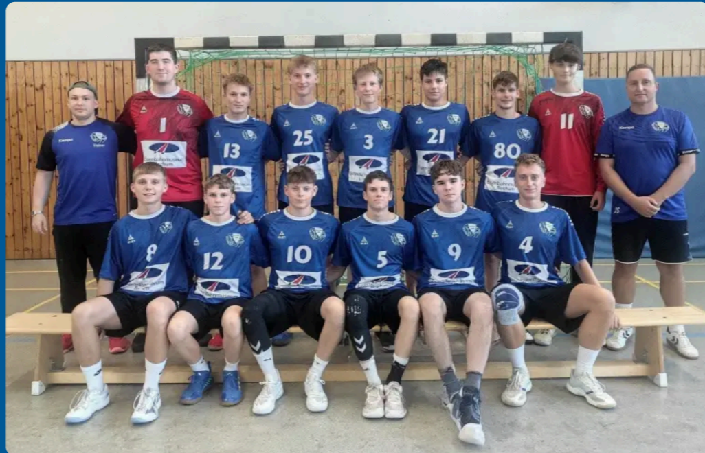
Saison 2025/2026: Team der 1. männlichen B-Jugend – Jahrgänge 2009 & 2010 – Oberliga