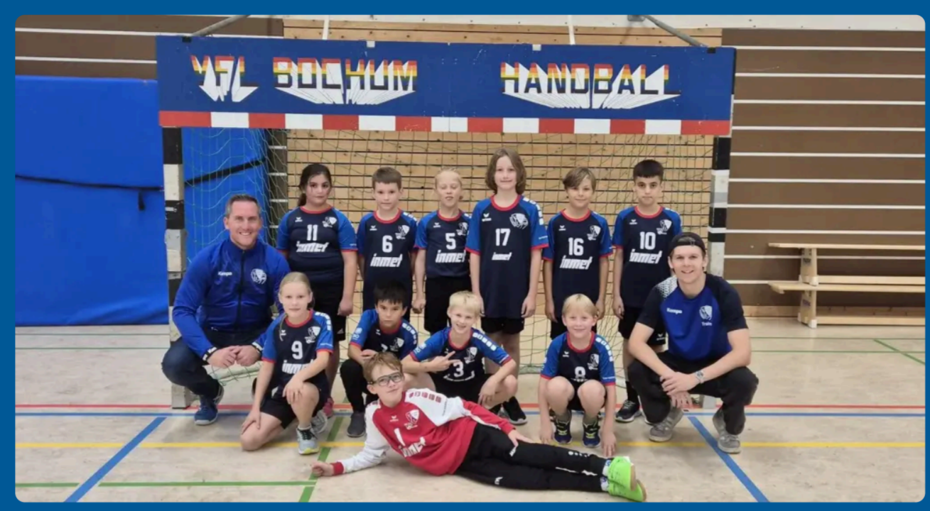
Saison 2025/26: Team der gemischten 2. E-Jugend – Jahrgänge 2015 & 2016 – Bezirksklasse